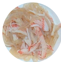
▲ カニカマと合わせた「しらたきサラダ」