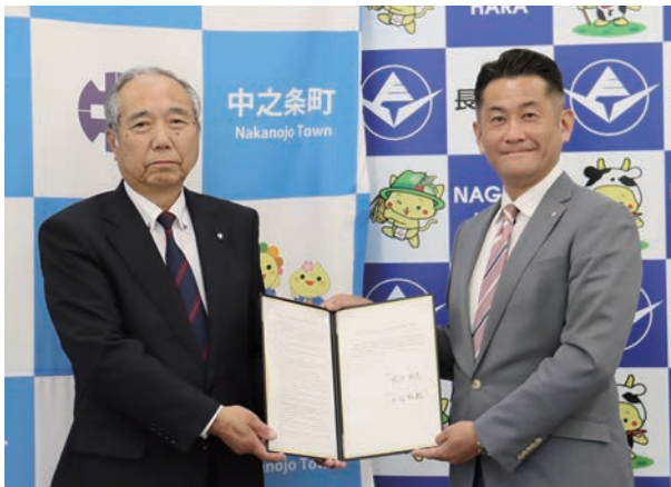
▲ 外丸町長(左)、萩原町長

6月10日（火）萩原睦男町長と中之条町の外丸茂樹町長による、教育に係る事務の委託に関する協議書調印式が長野原町役場にて執り行われました。両町では、6月議会において法定手続きとなる「規約」の議決を経て、長野原町への受託が正式に決まりました。