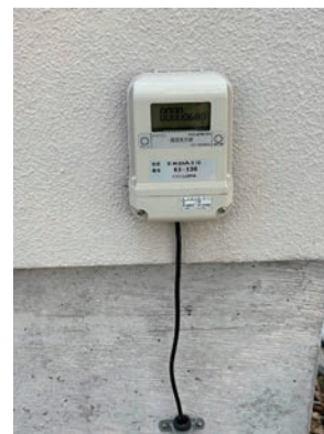
◀カウンターパネル