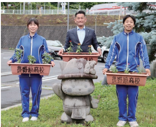
▲ 長野原高校の生徒たちと萩原町長