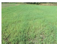
▲ 生育中のエンバク

メインの作物の収穫後に播種して、晩秋にすき込む作型ではエンバクは8月下旬まで、極早生のライムギなら9月中旬までに播種すること、すき込み時までに十分な生育量を確保することができ、(長野原町の高標高地の場合)