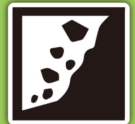
崖崩れ・地すべり